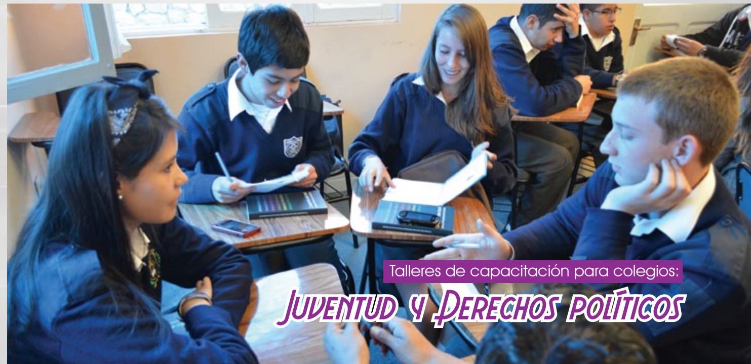
Talleres de capacitación para colegios:

Para las elecciones generales, la paridad debería observarse en el número total de candidatos de cada organización política, en el número de candidatos por cada cámara y en el número de candidatos por tipo de circunscripción y por departamento, para evitar que una organización política ponga “todos los huevos en la mejor canasta” y rellene su lista con candidatas sin posibilidades efectivas de triunfo.