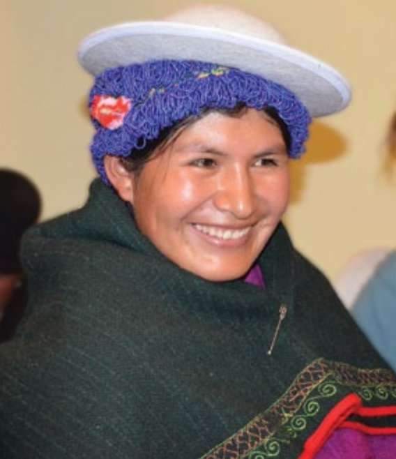
Plurinacional-Tribunal Supremo Electoral (OEP- TSE).

Además desde que la Asamblea Constituyente incorporó el termino de plurinacionalidad, los derechos de los pueblos indígenas, autonomías indígenas, entre otros ámbitos concerniente a los derechos humanos de los pueblos indígenas, en la Constitución Política del Estado (2009), conociendo que en Bolivia existen instituciones, sistemas políticos, jurídicos, económicos reconocidos acorde a la cosmovisión de las naciones y pueblos indígenas: Aymará, Quechua, Chiquitano, Guaraní, Mositén, Leco, Kallawayá, Tacana, Araona, Guarayo, Ayoreo, Yuracaré-Mojeño, Yuki, Chipaya, Murato, Weenayek, Tapiete, Pacahuara, Itonama, Joaquiniano, Maropa, Guarasugwe, Mojeño, Siriono, Baure, Tsimane, Movima, Cayubaba, Moré, Cavineño, Chácobo, Canichana, Yuracaré, Esse Ejja, Yaminagua, Machineri, por la diversidad existente implica la atención de sus demandas desde los derechos humanos.