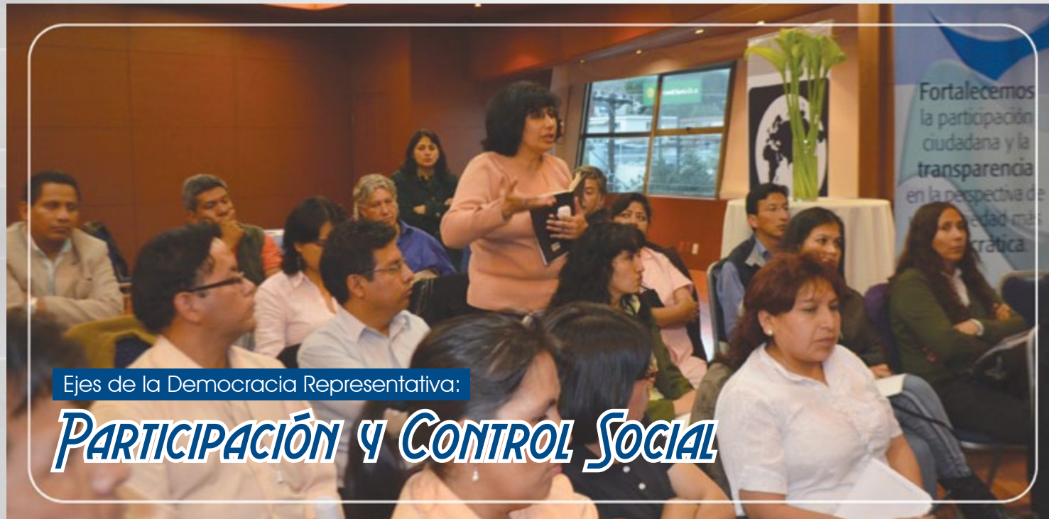
Por: Rocío Guachalla Unidad de Transparencia OEP/TSE

“El control a la gestión pública y a los servicios públicos debe ser una constante, teniendo como mandato legal todas las entidades estatales, la obligación de generar espacios de participación y control social... ...la Unidad de Transparencia y Control Social en el Tribunal Supremo Electoral, permitirá concientizar y normar en su interior la participación y control social...”