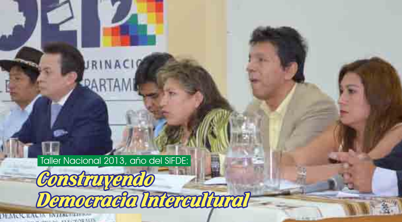
Taller Nacional 2013, año del SIFDE: