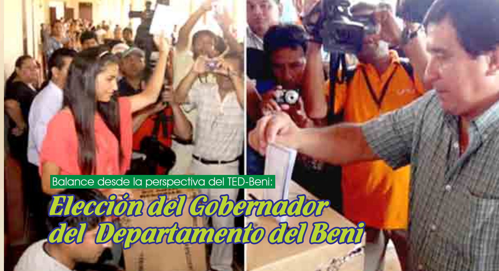
Balace desde la perspectiva del TED-Beni:

En tal sentido, el Encuentro 2013 del SIFDE-OEP/TSE, ha propuesto a Sala Plena que el presente año sea denominado "AÑO DEL SIFDE" para poner de manifiesto nuestra misión y responsabilidad institucional a la par de las necesidades que se deben contemplar para nuestro trabajo. Que este artículo sirva para visibilizar lo compartido y seguir avanzando en este horizonte colectivo de la Democracia Intercultural, al que mientras más nos intentamos acercar, más se aleja; cumpliendo su cometido de mantenernos en movimiento y siempre alertas.