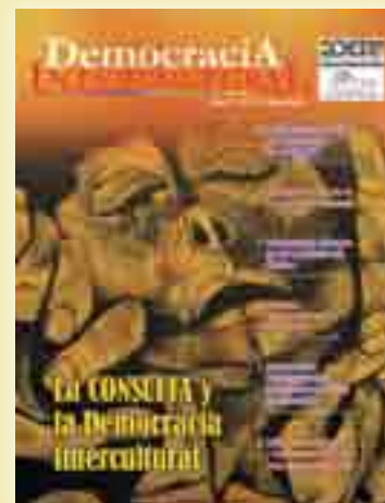
Portada: Obras de arte del artista ecuatoriano Osvaldo Guayasamin, en el Museo "La Casa del Hombre", Quito - Ecuador.

Impresión TIAGO Business Depósito Legal: 4-3-83-12 P.O.