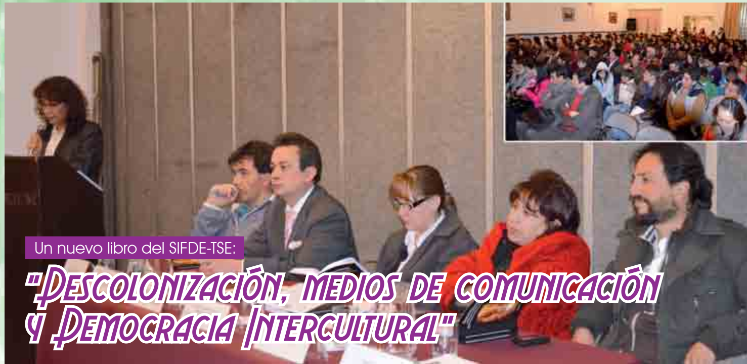
Un nuevo libro del SIFDE-TSE: